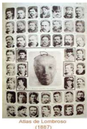
Fig. X : Legenda

prédestinée 7 , en somme, deviner les comportements antisociaux futurs. Le "type criminel" est né, mettant l'accent sur l'anormalité biologique de l'individu. Il porte à même le corps les signes de sa folie morale (Pinatel, 1987: 45-46.). Les clichés publiés sous forme d'atlas par Lombroso (Fig. 2) – collection de portraits individuels ayant pour finalité de proposer un portrait générique, une image de synthèse artificielle mais prise pour du réel 9 – est en quelque sorte un catalogue représentatif de toutes les déviances humaines d'origine physiologique excluant toute influence sociale 8 .