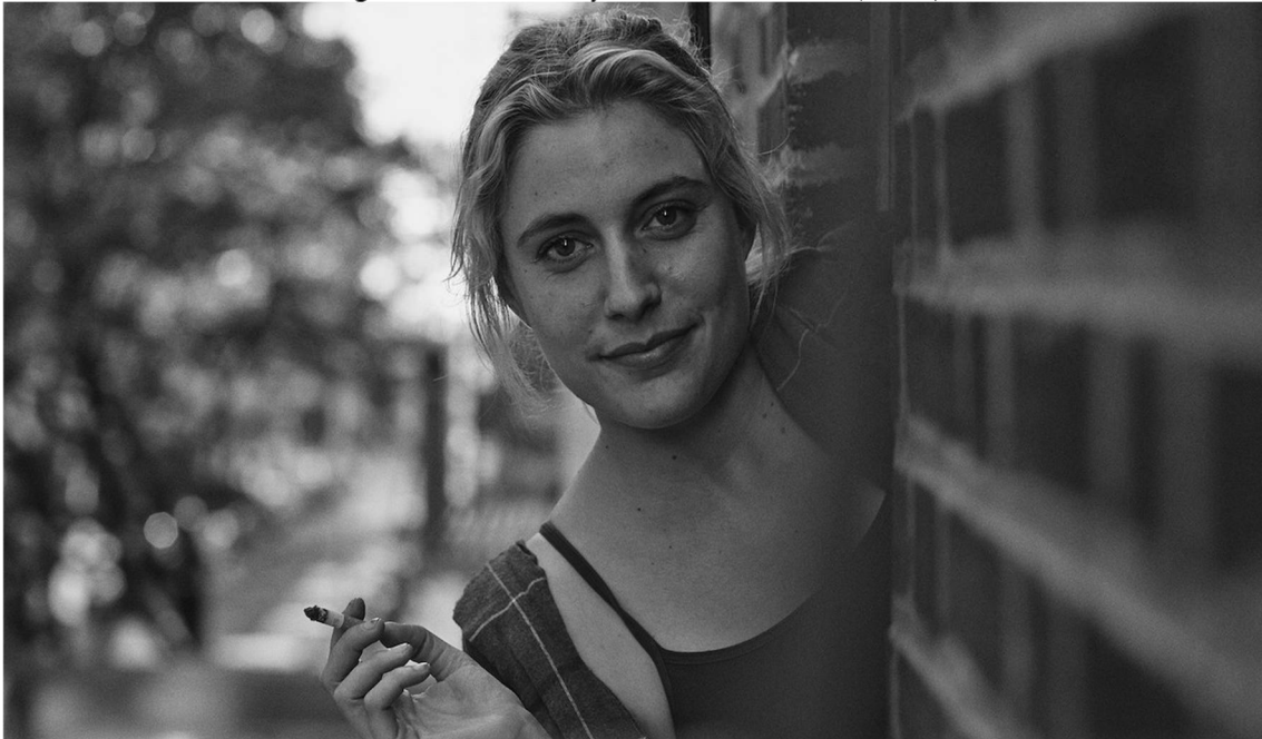
Figura 1. Cena do filme Frances Ha (2012)

Decompor os filmes para, na sequência, recompô-los, metodologia de análise proposta por Vanoye e Goliot-Lété (2012), é uma maneira de encontrar significações que num primeiro momento possam estar implícitas. Julie e Frances estão em praticamente todas as cenas, ou seja, existe um cuidado e uma dedicação em colocá-las em evidência, rompendo com a ideia da personagem feminina que necessita de um personagem masculino para existir na narrativa.