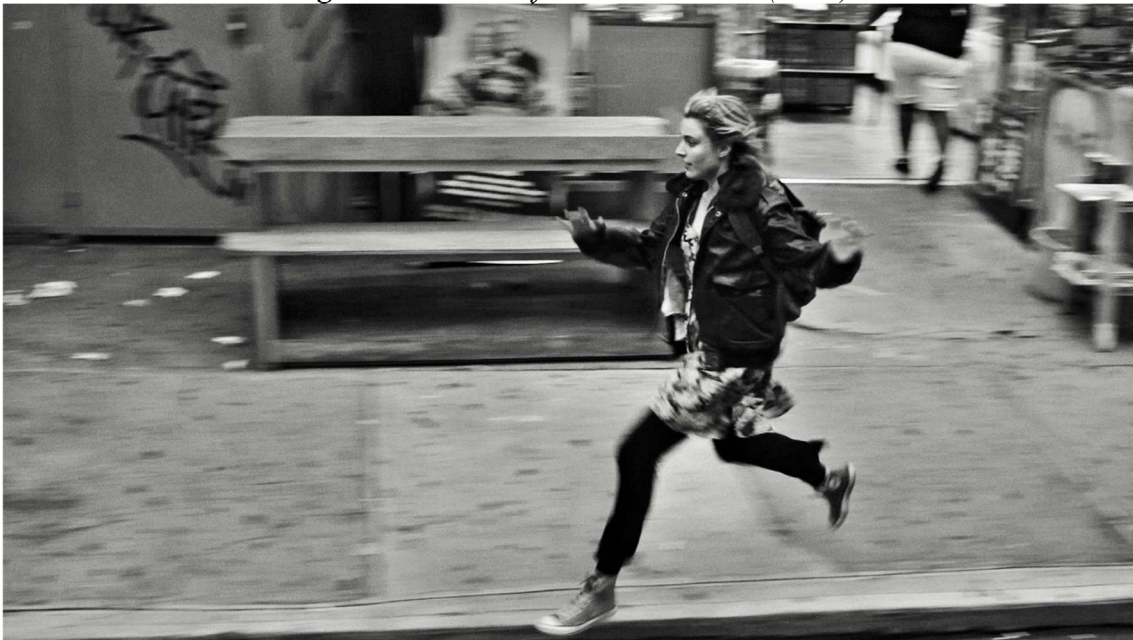
Figura 3. Cena do filme Frances Ha (2012)

As cenas em que Frances (figura 3) e Julie (figura 4) correm pela cidade, claramente satisfeitas por alguma decisão que tomaram, são bem claras nas ideias que querem transmitir. Os recursos visuais e sonoros utilizados reforçam os posicionamentos que assumiram: o de fazerem o que querem, independentemente de as consequências serem boas ou ruins. Frances Ha (2012) e A Pior Pessoa do Mundo (2021) trazem a representação de um feminino real e possível.