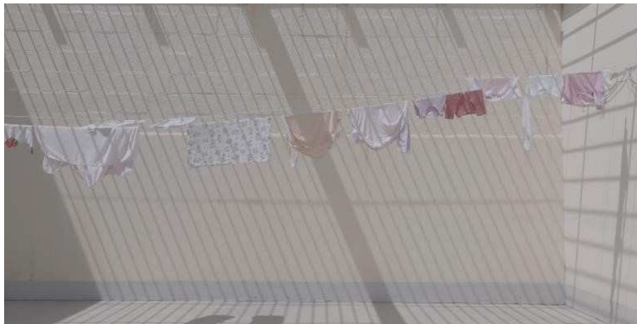
Fig.2 - Pátio da ala materno-infantil. Frame do filme C(elas) , fotografia de Ursula Dart.

As imagens seguintes são referentes ao espaço da ala em que as mulheres, e nós da equipe de filmagem, passávamos mais tempo: o pátio, ou quintal, espaço da ala de acesso livre e onde as mulheres e as crianças realizavam várias das suas atividades, como lavar as roupas dos bebês, estendê-las, estar com as crianças nos carrinhos — como a maioria são bebês recém-nascidos, costumam ficar menos tempo nos colos das mães. Foi lá onde conversávamos sobre vários assuntos, desde a amamentação, o parto, a relação entre as mulheres da ala, até o assunto mais delicado de todos, que é a questão principal do filme: o que é ser melhor mãe? É aquela que, ao ter a criança, entrega-a para que seja de imediato criada do lado de fora, não a amamentando e, por conseguinte, não gerando um vínculo ainda maior entre mãe e bebê ou é melhor mãe a que tem a criança e decide amamentá-la, passando alguns meses com o bebê na ala e entregando-o em seguida, garantindo a amamentação mas quebrando esse vínculo fundamental de maneira ainda mais brusca e violenta?