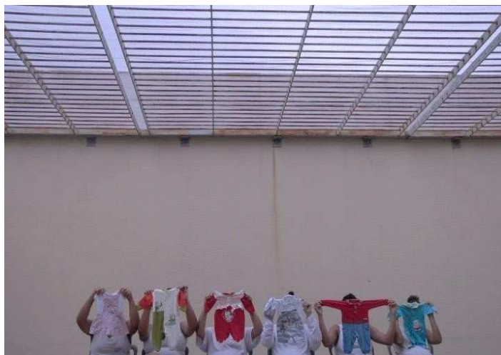
Fig.4 - mães ala materno-infantil sombreado. Frame do filme C(elas) , fotografia de Ursula Dart.

[...] formar as prisioneiras no “importante” papel feminino da domesticidade. Assim, um papel importante do movimento de reforma nas prisões para mulheres foi encorajar e inculcar papéis de gênero “apropriados”, como treinamento vocacional em culinária, costura e limpeza. Para acomodar esses objetivos, as casas reformatórias foram normalmente projetadas com cozinhas, salas de estar e até mesmo alguns viveiros para prisioneiras com bebês (Belknap apud Davis: 2017: 09).