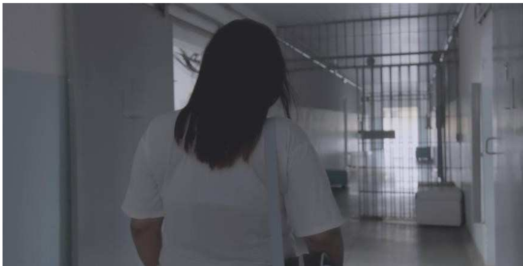
Fig.1 - Corredor da ala materno-infantil. Frame do filme C(elas). (Todas imagens apresentadas neste artigo são frames do filme e possuem, por isso, autorização para serem exibidas)

Nesta primeira imagem (Fig. 1) é possível visualizar o corredor da ala, no sentido contrário ao de sua entrada principal, que está no fim do corredor. Veem-se, também as entradas de acesso aos quartos: