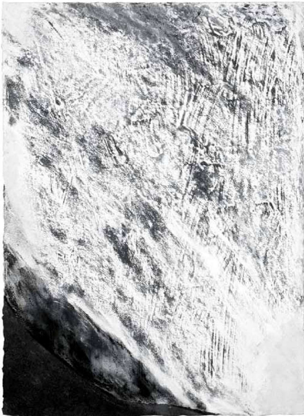
Quadro 1 - Matérias-luz e matérias-sombra, sobre papel feito à mão de Romy Castro, 2012.