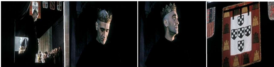
Fig. 1: plano sequência de Non ou a vã glória de mandar , de Manoel de Oliveira– 39’50”

Os soldados ainda escutam o alferes contar sobre a tentativa de unificar os reinos de Portugal e Espanha, não só pela guerra, mas também pelo casamento. Essa intenção de unificação dos reinos e ampliação do território é, também, frustrada, uma vez que o príncipe, filho de D. João II, morre em um banal acidente a cavalo. A morte do herdeiro do reino – que encarna a união dos reinos da península – é vista como uma fatalidade que faz cumprir a vontade do destino, deixando Portugal fadado a mais uma derrota. O plano que mostra a figura de D. João II no funeral do filho representa simbolicamente essa sensação de desolamento em que mergulha a esperança da unificação dos reinos, unificação esta que não se concretiza nem pela guerra, nem pela paz. O rei mostra-se profundamente mergulhado em um silêncio fúnebre, reforçado pela imagem de seu rosto isolado em um plano no qual sua veste negra mistura-se às sombras do espaço cênico e o homem em luto mira, com decepção, o estandarte do reino