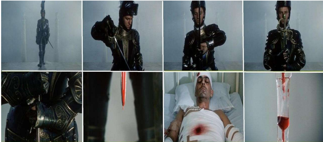
Fig. 4: sequência de planos do filme Non ou a vã glória de mandar, de Manoel de Oliveira – 1h47'02”

O plano narrativo que acontece em África, baseia-se quase que totalmente na força da palavra, uma vez que as ações se limitam à movimentação dos soldados no jipe e às histórias recontadas pelo alferes. O único momento em que o grupo realmente se envolve em uma ação é quando a tropa é convocada a uma missão no meio da selva e tem um embate com os inimigos. No embate derradeiro, o alferes é atingido pelas armas inimigas, o que resultará em sua morte. Na sequência final, vê-se o grupo terrivelmente ferido em uma ala hospitalar a observar as últimas horas do alferes, agonizando em seu leito durante muito tempo, até que finalmente morre.