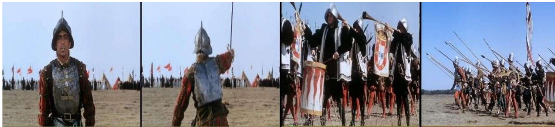
Fig. 2: plano-sequência de Non ou a vã glória de mandar , de Manoel de Oliveira – 1h18’30”

É fato que Cabrita assume, neste filme, o papel de um cronista, bem ao estilo de romance histórico. Nesse sentido, até pelo tom de rememoração o episódio mais marcante na recapitulação feita pelo alferes é a Batalha de Alcácer Quibir, retratada pelo realizador de forma teatral e muito peculiar. Manoel de Oliveira, através da voz de alferes Cabrita, desconstrói a imagem de D. Sebastião que é mostrado nessa obra, não mais de forma messiânica, enquanto o desejado ou o encoberto. El Rei Sebastião retratado em Non ou a vã glória de mandar é uma figura antagônica que reflete a violência tão característica do sistema colonial, resultado de sua tirania que fere não só o inimigo, mas também a si próprio e aos que estão sob o seu comando. No filme, antes da sequência da guerra em Alcácer-Quibir, os conselheiros tentam dissuadir o rei da ideia da batalha, já que os adversários apresentaram uma proposta pacífica de resolução do conflito. Entretanto, D. Sebastião, “senhor de sua vontade” como diz uma personagem no filme, insiste em ir à guerra, conduzindo seu exército para a morte, ao lado dos soldados alemães, italianos e espanhóis. O capitão Alexandre Moreira, interpretado também por Luís Miguel Cintra dirige-se ao exército português pedindo que testemunhassem como se apeava para morrer, pois não havia ali, naquele momento, qualquer outra opção. Essa postura reforça o destino ao qual o país estava fadado.