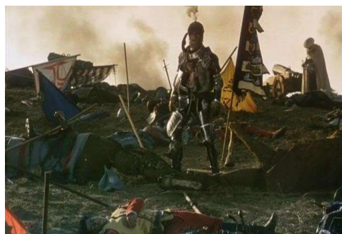
Fig. 3: plano de Non ou a vã glória de mandar , de Manoel de Oliveira – 1h34’15”

Após a batalha, quando os mouros já conduziam os prisioneiros ao cárcere, levanta-se no campo onde jazem os mortos, um soldado português já à beira da morte, que do centro da derrota, declama as palavras de Vieira sobre a terrível palavra que é o NON. Essa figura, já envelhecida encara a essência crítica desse filme que conduz ao título da película. Este homem visivelmente remete o espectador à imagem icônica do Velho do Restelo camoniano e sua incisiva crítica à vã glória de mandar, ao mesmo tempo que entoa as palavras de Vieira sobre a fatalidade de um NON, cíclico e predestinado à sua essência de derrota e perda. Ali, na batalha de Alcácer-Quibir, Portugal completa mais um ciclo de lutas inglórias, mais uma tentativa vã de conquista.