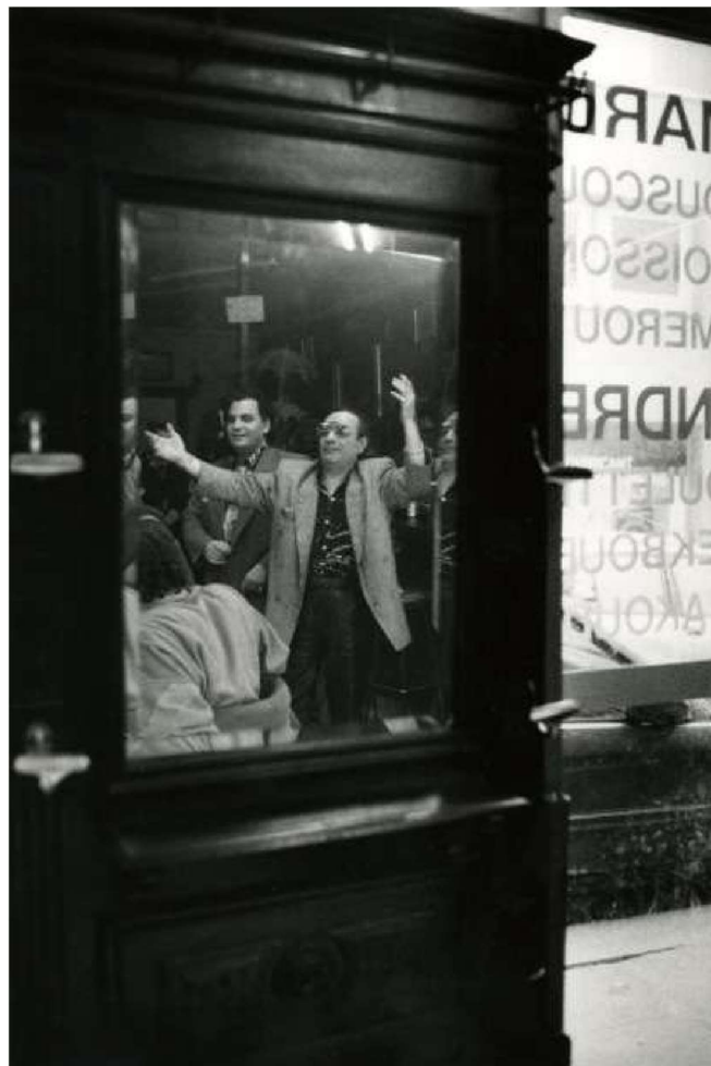
Photo 3 - Ambiance un dimanche dans un café du quartier de Belleville, Paris, France