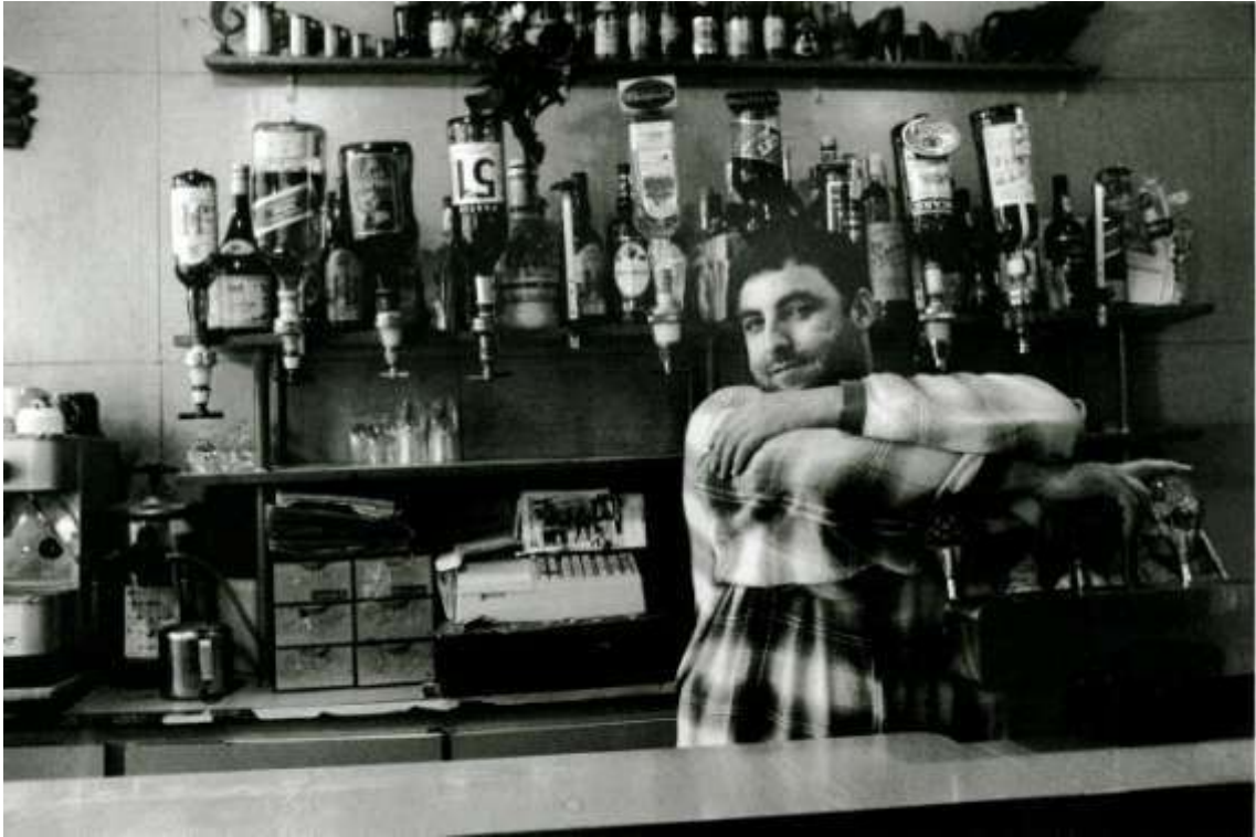
Photo 2 - Patron d'un café du quartier de Belleville, Paris, France